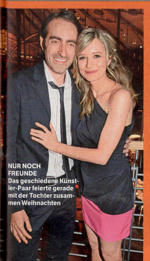
NUR NOCH FREUNDE Das geschiedene Künstler-Paar feierte gerade mit der Tochter zusammen Weihnachten