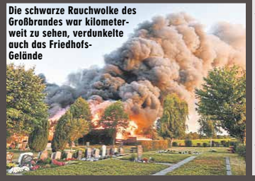
Die schwarze Rauchwolke des Großbrandes war kilometerweit zu sehen, verdunkelte auch das Friedhofs-Gelände

Die Kripo hat die ausgebrannten Lagerhallen an der Edemissener Straße mit Spürhunden abgesucht, Spuren gesichert. Polizei-Sprecher Matthias Pintak: „Es ergeben sich zum gegenwärtigen Ermittlungsstand keine Hinweise auf einen technischen Defekt.“ Ob das Feuer allerdings fahrlässig oder vorsätzlich ausgelöst wurde, sei noch unklar.