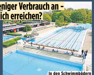
In den Schwimmbädern wie dem Lister Bad werden die Becken weniger beheizt. Die Duschen bleiben künftig kalt